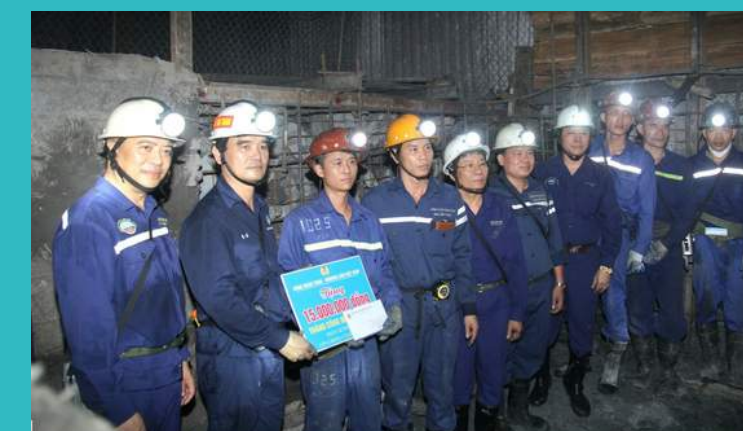
Lãnh đạo Công đoàn TKV, Đảng ủy và Công đoàn Công ty thăm động viên công nhân trong Tháng hành động An toàn, vệ sinh lao động