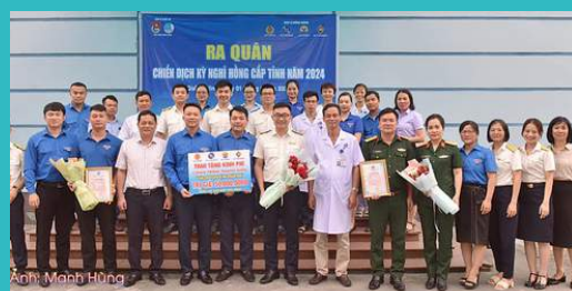
ĐTN Bệnh viện Than - Khoáng sản tặng quà tổ chức khám bệnh, phát thuốc miễn phí, tặng sữa cho 220 người dân có hoàn cảnh khó khăn xã Chu Trinh