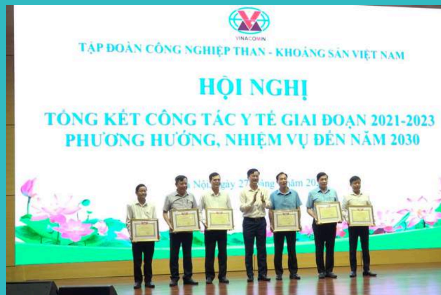
Tập đoàn khen thưởng 06 tập thể có thành tích trong công tác chăm sóc sức khỏe người lao động giai đoạn 2021-2024