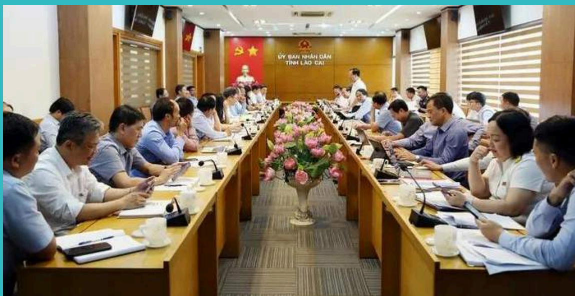
TKV xin chuyển đổi mục đích sử dụng đất cho Dự án mở rộng nâng công suất mỏ đồng Sin Quyền