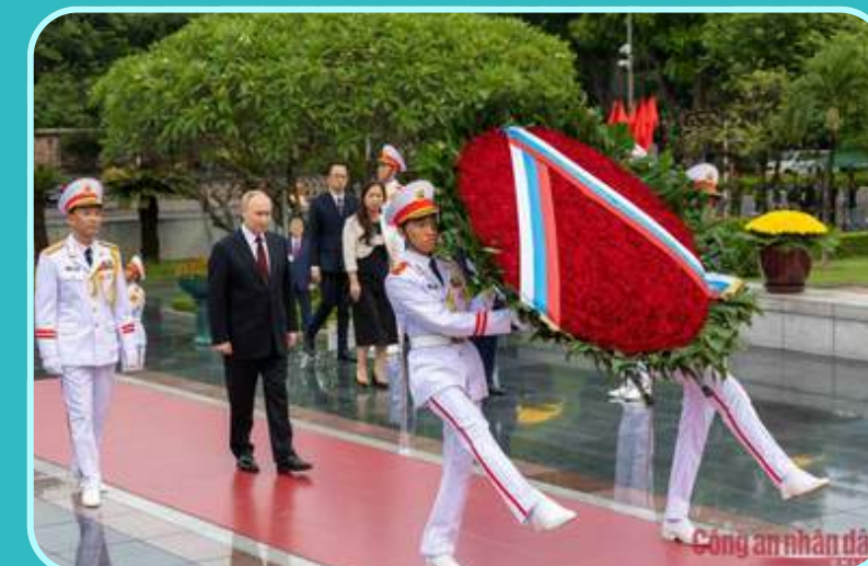
Tổng thống Vladimir Vladimirovich Putin dâng hoa tại Đài tưởng niệm các Anh hùng, liệt sĩ và Lăng Chủ tịch Hồ Chí Minh

Nhân dịp này, Việt Nam và Liên bang Nga đã ra Tuyên bố chung về làm sâu sắc hơn quan hệ đối tác chiến lược toàn diện Việt Nam - Liên bang Nga trên cơ sở thành tựu 30 năm thực hiện Hiệp ước về những nguyên tắc cơ bản của quan hệ hữu nghị giữa Việt Nam và Liên bang Nga, đánh giá cao những thành tựu quan trọng của quan hệ hai nước, khẳng định các nguyên tắc, đề ra những định hướng để đẩy mạnh và tăng cường hợp tác, phát triển quan hệ hữu nghị truyền thống và đối tác chiến lược toàn diện Việt Nam - Liên bang Nga, vì lợi ích lâu dài của nhân dân hai nước, vì hòa bình, an ninh và phát triển bền vững tại khu vực và trên thế giới.