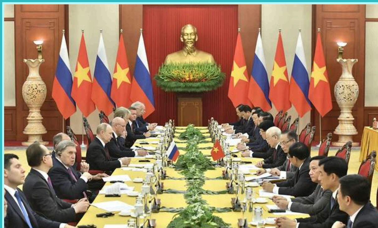
Tổng thống Nga Vladimir Vladimirovich Putin đã có các cuộc hội đàm với Tổng Bí thư Ban Chấp hành Trung ương Đảng Cộng sản Việt Nam Nguyễn Phú Trọng và Chủ tịch nước Tô Lâm

Nhận lời mời của Tổng Bí thư Ban Chấp hành Trung ương Đảng Cộng sản Việt Nam Nguyễn Phú Trọng, Tổng thống Liên bang Nga Vladimir Vladimirovich Putin có chuyến thăm cấp Nhà nước đến nước Cộng hòa xã hội chủ nghĩa Việt Nam từ ngày 19 đến ngày 20/6/2024. Chuyến thăm diễn ra trong bối cảnh hai nước kỷ niệm 30 năm ký kết Hiệp ước về những nguyên tắc cơ bản của quan hệ hữu nghị giữa Cộng hòa xã hội chủ nghĩa Việt Nam và Liên bang Nga (16/6/1994).