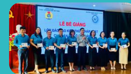
Bế giảng lớp đào tạo kiến thức pháp luật cho cán bộ Công đoàn