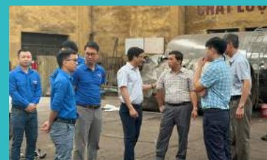
Thăm các nhà xưởng tại các đơn vị sản xuất của TKV trên địa bàn Cao Bằng

(4) Phối hợp kiểm tra kết quả 01 năm thực hiện Kế hoạch liên tịch số 15-KHLT/ĐTQN-ĐTKV, ngày 15/6/2023 của Ban Thường vụ Đoàn Than Quảng Ninh và Ban Thường vụ Đoàn TKV về việc thực hiện công tác vệ sinh môi trường nơi làm việc, nhà điều hành và khai trường sản xuất giai đoạn 2023-2025.