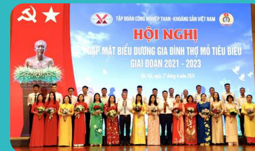
Lãnh đạo Đảng ủy TKV và Công đoàn TKV trao biểu trưng và hoa cho các gia đình thợ mỏ tiêu biểu

(4) Triển khai hướng dẫn, tổng hợp danh sách biểu dương con CNVCLĐ đạt thành tích xuất sắc trong học tập năm học 2023-2024; báo cáo kết quả thực hiện Tháng hành động vì trẻ em năm 2024.