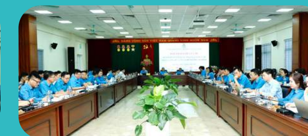
Tọa đàm nâng cao chất lượng bữa ăn cho người lao động