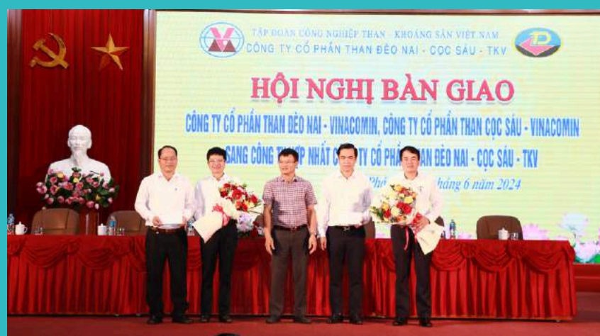
TKV khen thưởng Ban chỉ đạo tái cơ cấu Công ty cổ phần Than Đèo Nai - Vinacomin và Công ty cổ phần Than Cọc Sáu - Vinacomin với tổng số tiền thưởng 100 triệu đồng