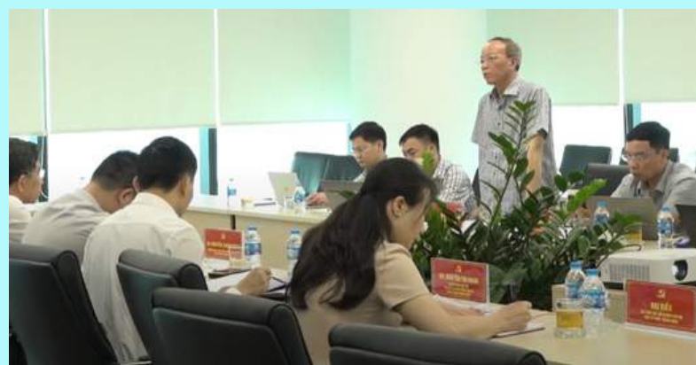
Đồng chí Khuất Mạnh Thắng, Phó Bí thư Thường trực Đảng ủy TKV báo cáo công tác đào tạo, bồi dưỡng lý luận chính trị, xây dựng Đảng đối với cán bộ lãnh đạo, quản lý tại Tập đoàn