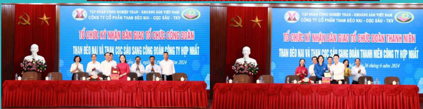
Ký bàn giao và tiếp nhận tổ chức Đảng, Công đoàn, Đoàn TN Công ty cổ phần Than Đèo Nai, Công ty cổ phần Than Cọc Sáu sang Đảng ủy, Công đoàn, Đoàn TN Công ty cổ phần Than Đèo Nai - Cọc Sáu - TKV