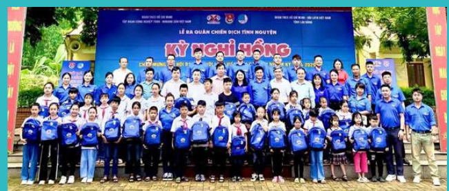
Trao cặp sách và sữa cho 50 em học sinh có hoàn cảnh khó khăn, có thành tích cao trong học tập trên địa bàn xã Chu Trinh, TP Cao Bằng