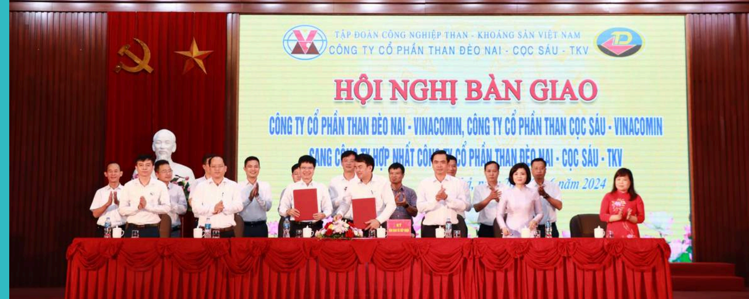
Ký bàn giao và tiếp nhận Công ty cổ phần Than Đèo Nai - Vinacomin, Công ty cổ phần Than Cọc Sáu - Vinacomin sang công ty hợp nhất Công ty cổ phần Than Đèo Nai - Cọc Sáu - TKV

Ngày 26/6, tại TP. Cẩm Phả đã diễn ra hội nghị bàn giao Công ty cổ phần Than Đèo Nai - Vinacomin, Công ty cổ phần Than Cọc Sáu - Vinacomin sang công ty hợp nhất Công ty cổ phần Than Đèo Nai - Cọc Sáu - TKV.