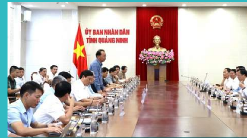
TKV đề nghị UBND tỉnh Quảng Ninh xem xét chấp thuận chủ trương đầu tư xây dựng cảng Con Ong-Hòn Nét