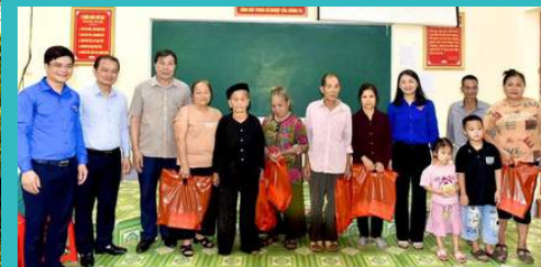
Tặng quà các gia đình có hoàn cảnh khó khăn

(1) Tổ chức các hoạt động trong Tháng hành động vì trẻ em: Khánh thành Công trình thanh niên “Sân chơi cho bệnh nhi” hưởng ứng Chiến dịch tình nguyện hè năm 2024; các cơ sở Đoàn trực thuộc tổ chức các lớp học năng khiếu hè cho con em người lao động tại đơn vị.