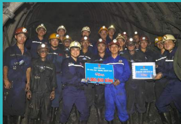
Thăm, tặng quà tổ sản xuất thanh niên tiêu biểu Công ty Than Quang Hanh-TKV