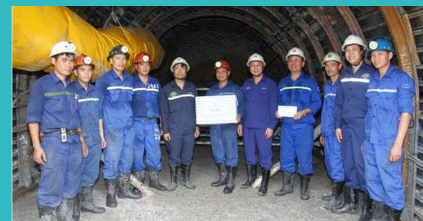
Lãnh đạo Đảng ủy và Công đoàn Công ty thăm động viên công nhân trong Tháng hành động An toàn, vệ sinh lao động