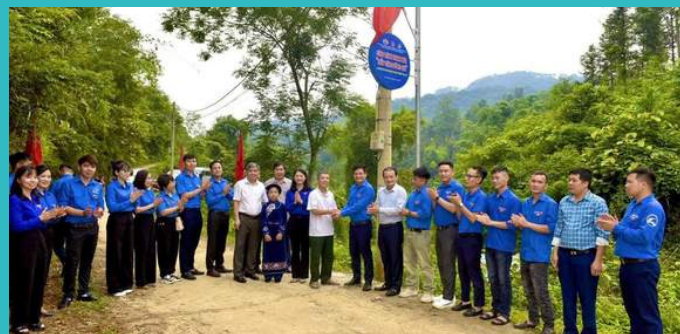
Khánh thành tuyến đường thấp sáng đường quê tại xã Chu Trinh, TP Cao Bằng