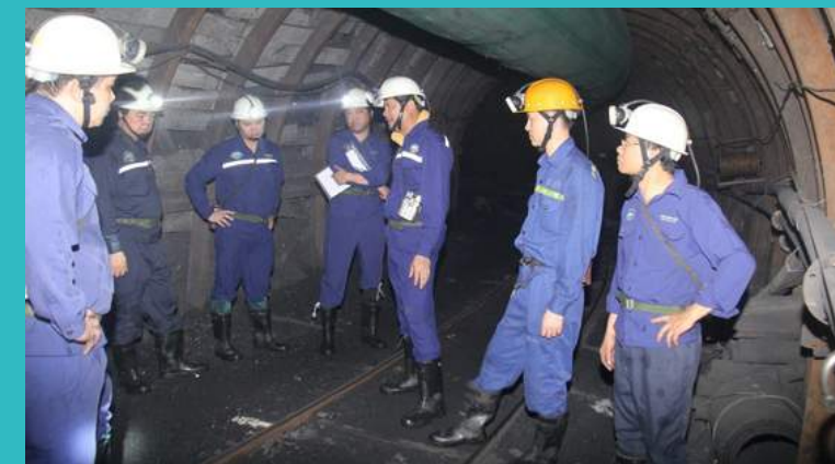
Lãnh đạo Công ty đi kiểm tra, chỉ đạo sản xuất và thăm động viên người lao động tại các phân xưởng đào lò