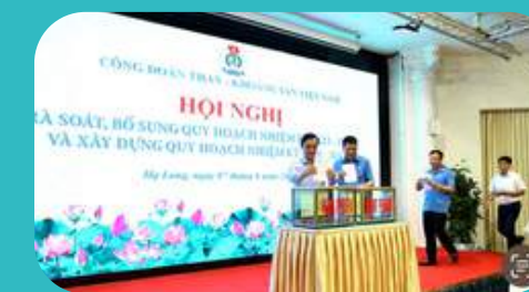
Hội nghị công tác cán bộ