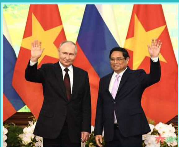
Hội kiến giữa Tổng thống Nga với Thủ tướng Chính phủ Phạm Minh Chính và Chủ tịch Quốc hội Trần Thanh Mẫn