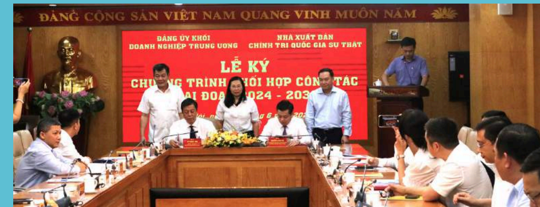
Lễ ký kết chương trình phối hợp công tác giữa Đảng ủy Khối Doanh nghiệp Trung ương và Nhà xuất bản Chính trị quốc gia Sự thật giai đoạn 2024-2030

Trong 10 năm qua, hai đơn vị đã chủ động trao đổi, cung cấp tình hình liên quan đến công tác biên soạn, xuất bản, phát hành sách, tài liệu, hướng dẫn cho các tổ chức đảng trực thuộc. Đây là hoạt động thiết thực, góp phần tích cực trong việc gắn kết giữa Đảng ủy Khối Doanh nghiệp Trung ương với Nhà xuất bản Chính trị quốc gia Sự thật.