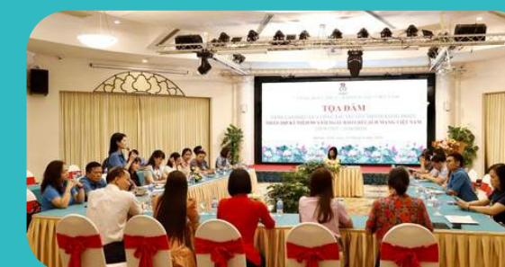
Tọa đàm nâng cao hiệu quả công tác truyền thông nhân kỷ niệm 99 năm ngày Báo chí Cách mạng Việt Nam 21/6