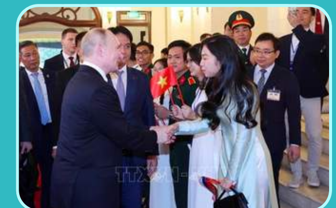
Tổng thống Vladimir Vladimirovich Putin gặp gỡ với cựu sinh viên Việt Nam từng tốt nghiệp tại các trường đại học của Liên Xô và Nga