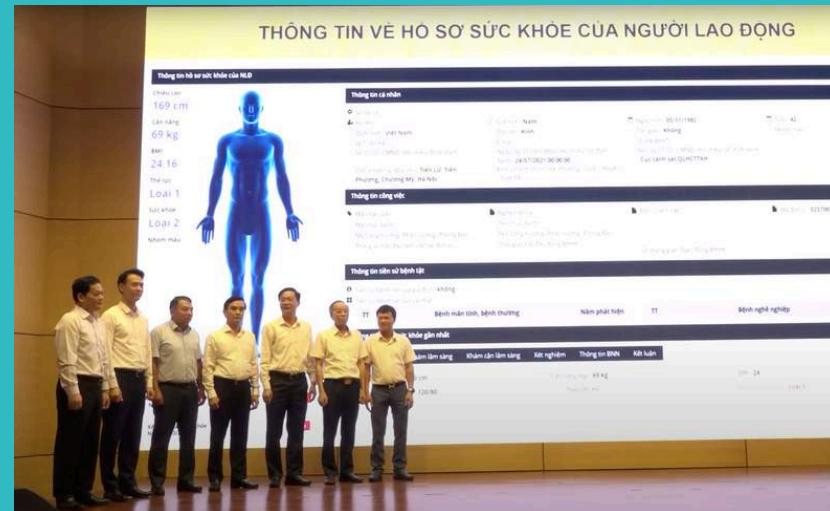
Lãnh đạo Tập đoàn và Bệnh viện Than - Khoáng sản thực hiện nghi thức phát động liên thông hệ thống sức khỏe người lao động trong toàn TKV

Ngày 27/6, tại Hà Nội, Tập đoàn tổ chức Hội nghị tổng kết công tác y tế giai đoạn 2021-2023; triển khai phương hướng, nhiệm vụ đến năm 2030.