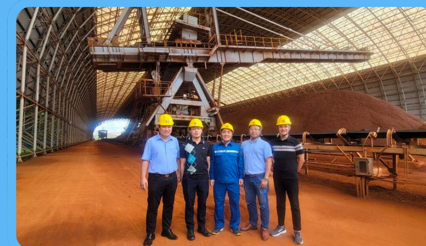
Cán bộ của IMSAT khảo sát hiện trường phục vụ công tác nghiên cứu lựa chọn công nghệ và thiết bị