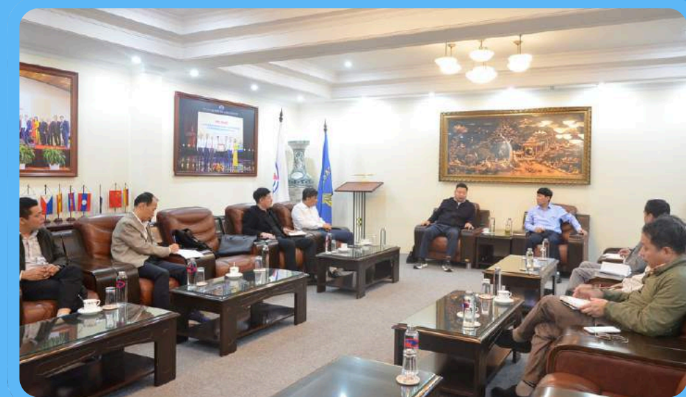
Làm việc với Công ty TNHH Thiết bị tuyển chống mài mòn Bắc Kinh - Trung Quốc

Bên cạnh đó, IMSAT đã phối hợp với một số đơn vị tư vấn nước ngoài và đơn vị khai thác, chế biến than - khoáng sản trong TKV triển khai nghiên cứu giải pháp công nghệ, thiết bị tiên tiến cho các nhà máy tuyển than xây dựng mới tại vùng Quảng Ninh; nghiên cứu các giải pháp thu hồi khoáng sản có ích trong các nhà máy tuyển.