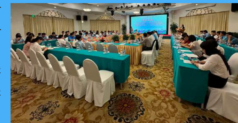
Hội nghị giao ban công tác dư luận xã hội và công tác thông tin, tuyên truyền quý I, triển khai nhiệm vụ quý II năm 2024